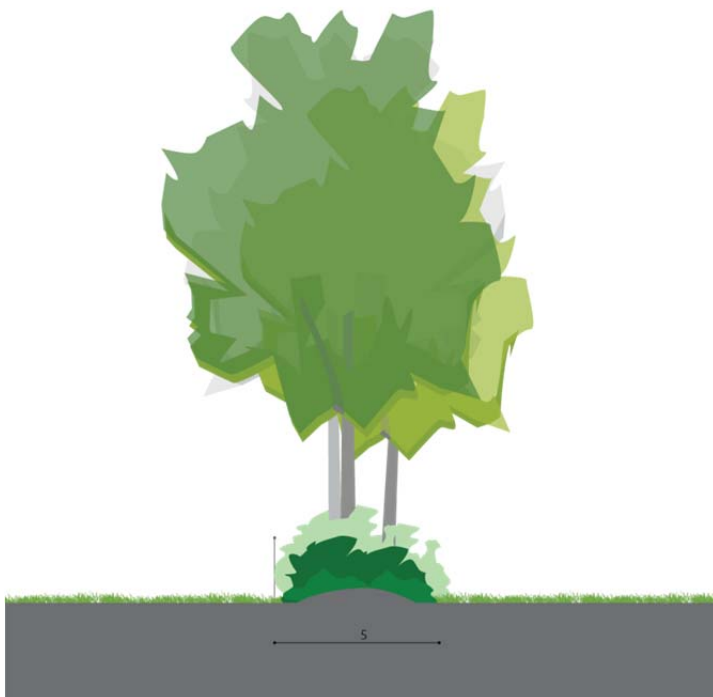
Figuur 6 Westelijke houtwal vormt de overgang naar het toekomstige Biobased Transitiepark fase 2