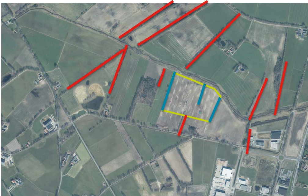
Figuur 1 bestaande houtwallen (rood) of restanten daarvan haaks op de Leerinkbeek. Plangebied in het groen en de nieuwe houtwallen in blauw

Voor de bioraffinagefabriek worden op de oostelijke en westelijke kavelgrenzen nieuwe houtwallen gerealiseerd. Tussen twee functies op het terrein wordt eveneens een houtwal gerealiseerd haaks op de Leerinkbeek