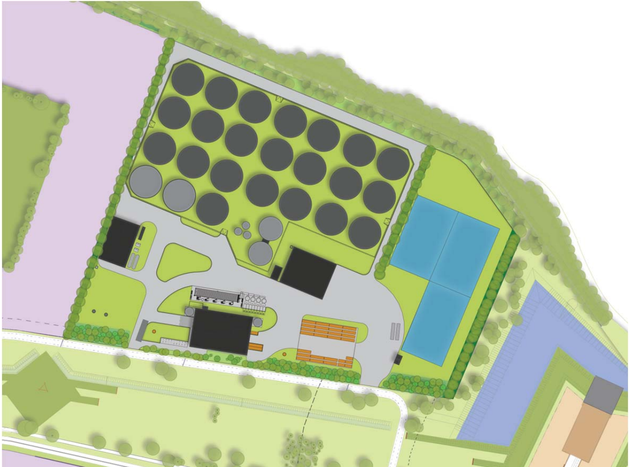
Figuur 4 Bioraffinagefabriek landschappelijk ingepast

De bomen in zone bestaat uit is een variatie uit een viertal soorten, wat een gevarieerd beeld oplevert. De soorten zijn; de gewone vogelkers ( Prunus padus ), de veldesdoorn ( Acer campestre ), de gewone haagbeuk ( Carpinus betulus ) en de krent ( Amelanchier lamarckii ).