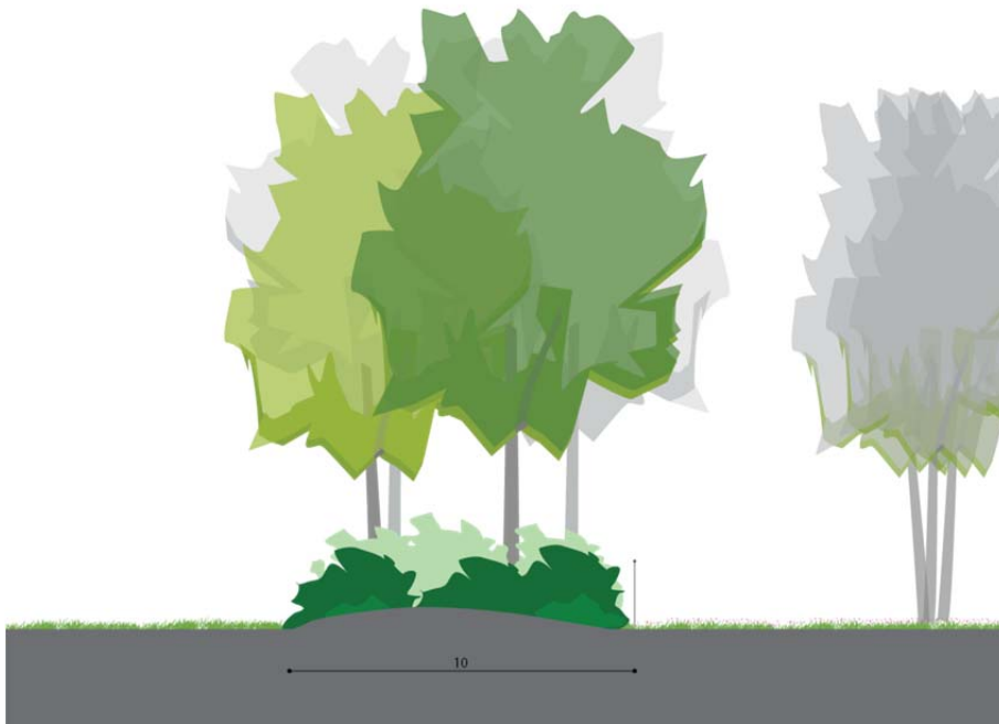
Figuur 5 Oostelijke houtwal een robuuste structuur als overgang naar Verbindingszone