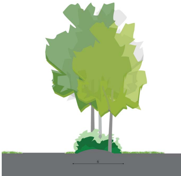
Figuur 7 Houtwal op het terrein draagt bij aan versterking van de landschapsstructuren en vormt een groene geleiding op het terrein.

In de bijlage tref je het landschapsplan op de schaal 1:1000 aan inclusief de profielen van houtwallen en een aanzicht vanaf de Verbindingszone. In het bestemmingsplan staat dat 5% van het perceel ingevuld dient te worden met een landschapsplan/ landschappelijke inpassing. In bovenliggend ontwerp is hieraan voldaan. Het kavel bedraagt ca 86.575 m 2 . Het ruimtebeslag voor de landschappelijke inpassing dient daarmee minimaal 4.330 m 2 te zijn. De drie houtwallen dragen samen 3.825 m 2 bij en het 'groene scherm' 2.990 m 2 .